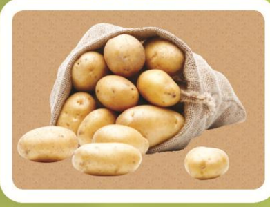
Пусиши тари лундаҳо