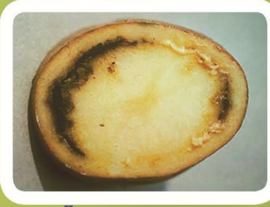
Пусиши халқашакли лундаҳо