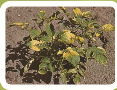
Вирус AMV (мозаика)