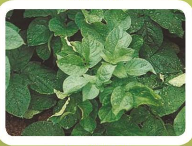
Вирус Mop – топ