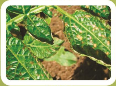
Вирус M ва L