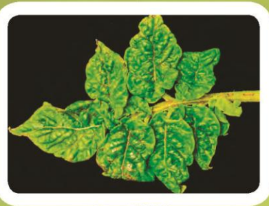
Вирус Y (PVY)