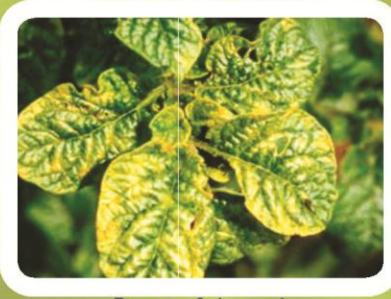
Вирус лукуба (мозаика)