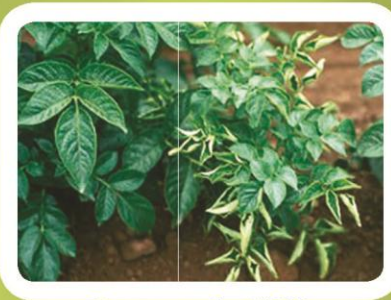
Вируси печияи барг (PLRV)