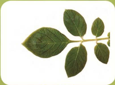
Вирус X (PVX)